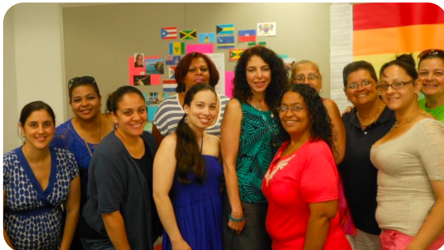
OSEP Glossary Project Focus Group at Advocates for Children in New York